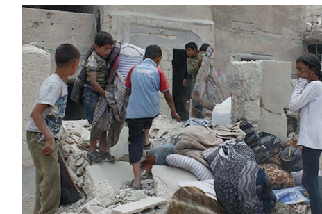
Fortsetzung Seite 2

Gemäss UNO-Hochkommissariat für Flüchtlinge sind heute 68.5 Millionen Menschen auf der Flucht, schwerpunktmässig aus Syrien, Afghanistan und dem Südsudan. Die allermeisten verlassen ihre Dörfer und suchen Schutz in andern Teilen ihres eigenen Landes, deshalb halten sich 85% der Flüchtenden in Entwicklungsländern auf.