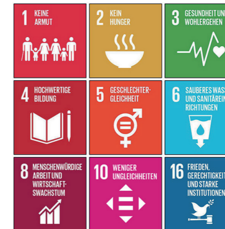
Eine Auswahl der 17 Sustainable Development Goals (SDG); ein Schlüssel, was Menschen zur Flucht treibt...

Niemand verlässt sein Land aus freien Stücken. Wo Frieden, Gerechtigkeit, Nahrung, Wasser, Gesundheit, Arbeit, Bildungschancen und Gleichberechtigung gegeben sind, gibt es kaum Gründe, seine Heimat zu verlassen. In den Sustainable Development Goals (SDG) sind diese grundlegendsten Bedürfnisse umschrieben. Wenn diese Voraussetzungen für das menschliche Leben verletzt sind, sei es durch Krieg,